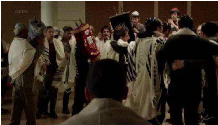
Fig. 5. Sim'hat Torah (2.3)